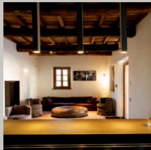
Qui sopra, antichi elementi del mulino e nuovi arredi si incontrano nelle tonalità di colori caldi e avvolgenti. Sotto, una delle due sale meeting, interrate ma luminosissime di luce naturale.