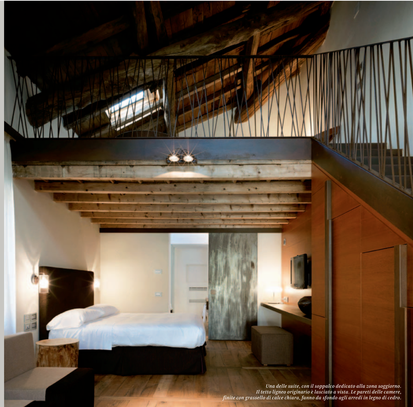
Una delle suite, con il soppalco dedicato alla zona soggiorno. Il tetto ligneo originario è lasciato a vista. Le pareti delle camere, finite con grassello di calce chiara, fanno da sfondo agli arredi in legno di cedro.