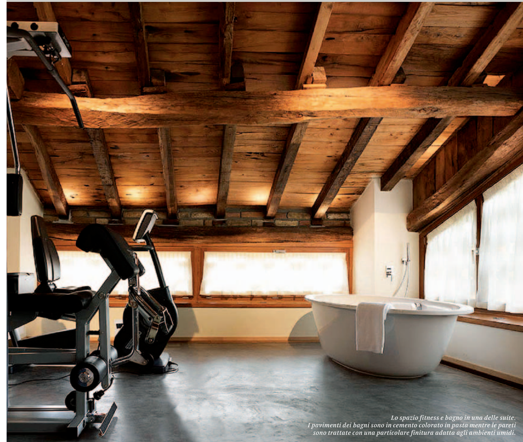
Lo spazio fitness e bagno in una delle suite. I pavimenti dei bagni sono in cemento colorato in pasta mentre le pareti sono trattate con una particolare finitura adatta agli ambienti umidi.

dotate di tutte le tecnologie necessarie per connessioni WiFi, videoconferenze e servizi office personalizzabili. Le sale sono affiancate da un coffee corner per i momenti di pausa, con l'offerta di prodotti della gastronomia locale. //