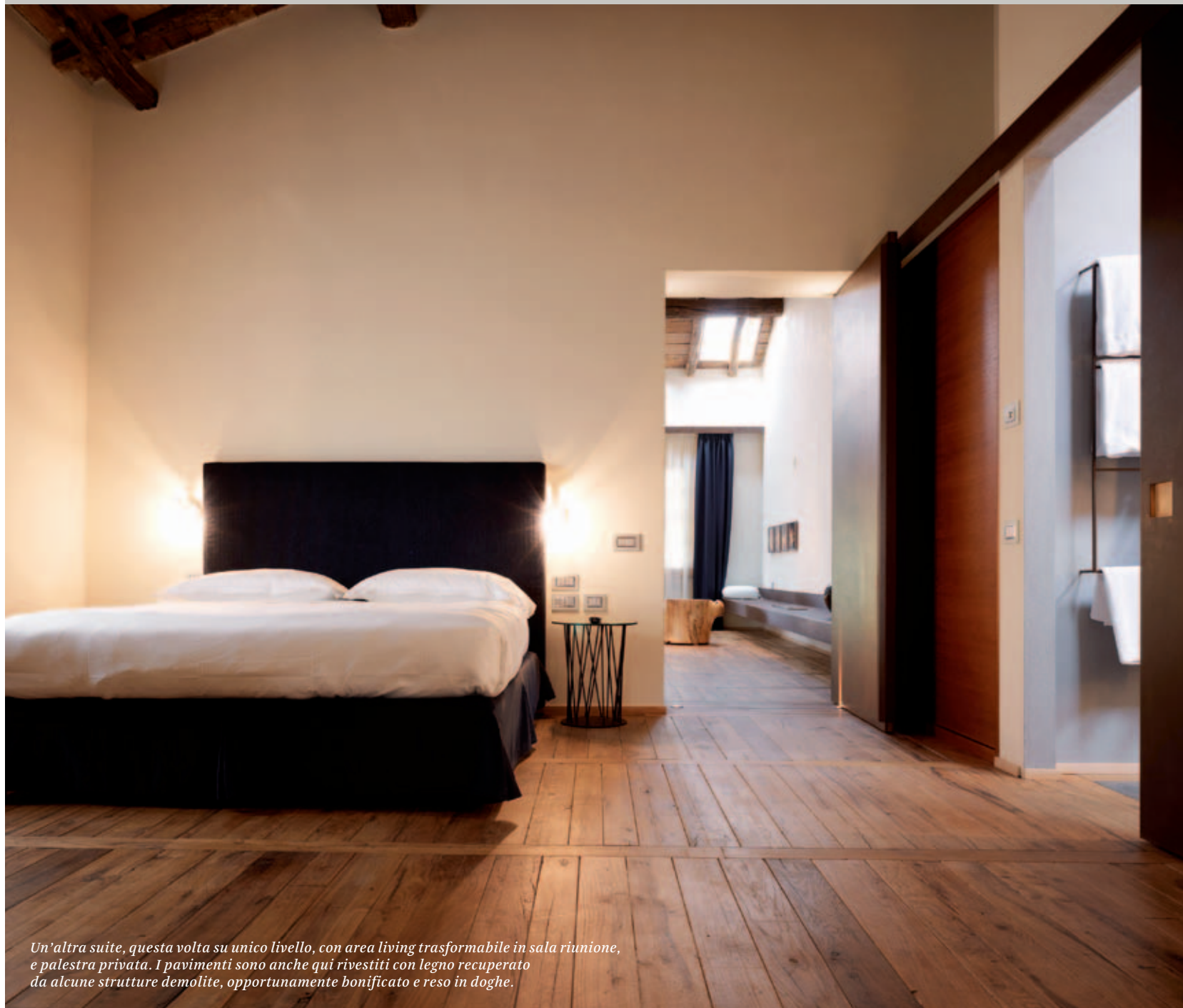
Un'altra suite, questa volta su unico livello, con area living trasformabile in sala riunione, e palestra privata. I pavimenti sono anche qui rivestiti con legno recuperato da alcune strutture demolite, opportunamente bonificato e reso in doghe.

al caso, dal pavimento ligneo della perugina Margaritelli ai tavoli e alle sedie Schönuber Franchi, dai tovagliati confezionati da artigiani locali alle posate di Sambonet, alle porcellane Rosenthal.